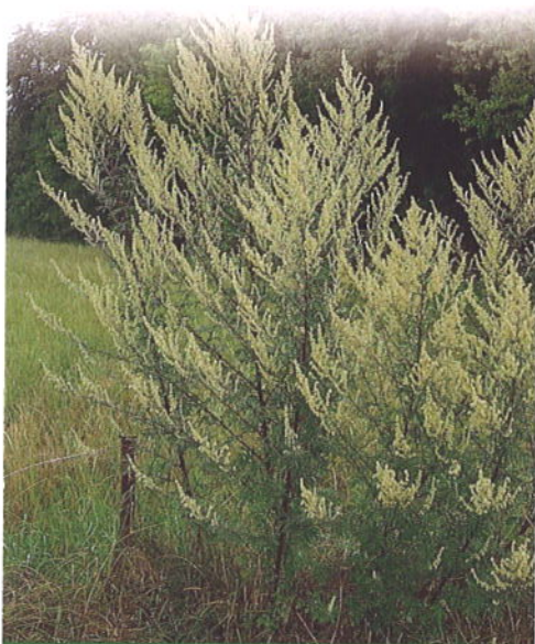
ARMOISE VULGAIRE EN FLEUR

Observatoire des ambrosies, d'après DDAS Rhône