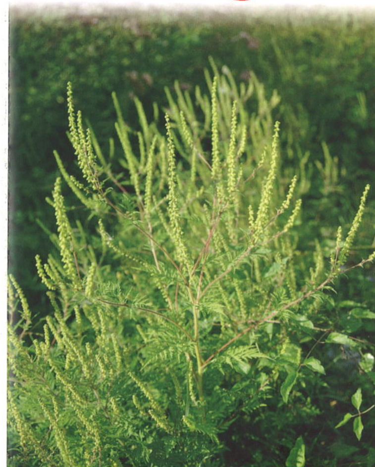
AMBROISIE A FEUILLES D'ARMOISE