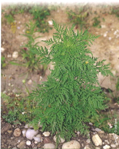
L'AMBROISIE AVANT FLORAISON