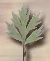
Feuille d'armoise commune (face inférieure)

Très découpées d'un vert uniforme sur les deux faces.